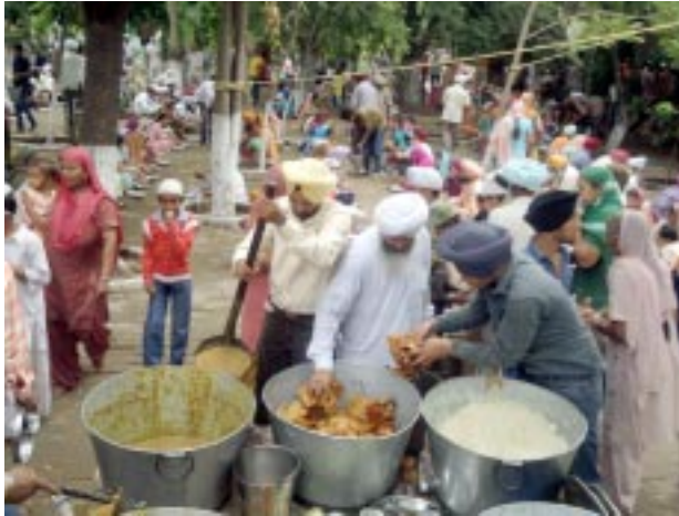
17 ਜੂਨ ਨੂੰ ਲੰਗਰ ਦਾ ਇੱਕ ਦ੍ਰਿਸ਼

ਵਿੱਚ ਮੌਲਸਰੀ, ਔਲਾ, ਬਹੋੜਾ, ਅੰਬ, ਆਂਵਲਾ, ਨਿੰਮ, ਪਿੱਪਲ, ਬਰੋਟੇ,