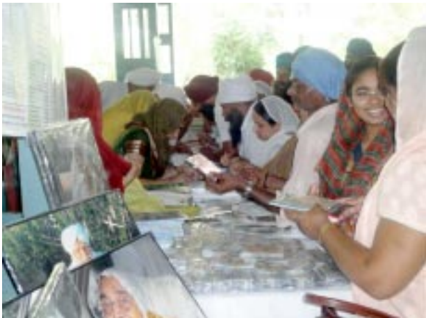
17 ਜੂਨ ਨੂੰ ਗੁਰ-ਸ਼ਬਦ ਲੰਗਰ ਆਤਮ-ਮਾਰਗ ਦੀ ਮੈਂਬਰਸਿੱਪ ਅਤੇ ਪੁਸਤਕਾਂ ਪ੍ਰਾਪਤ ਕਰਦੀਆਂ ਹੋਈਆਂ ਸੰਗਤਾਂ

ਜਾਮਣ, ਨਿੰਬੂ, ਜਮੋਆ, ਟਾਹਲੀ, ਅਰਜਨ, ਅਸ਼ੋਕਾ, ਅਮਰੂਦ, ਬੇਰ, ਕੇਲੇ, ਸਟੀਵੀਆ, ਹਲਦੀ, ਜੜੀ ਬੂਟੀਆਂ, ਚਕਰਸੀਆ ਆਦਿ ਦਰਖਤ ਲਗਾ ਕੇ ਆਸ਼ਰਮ ਅੰਦਰ ਆਕਸੀਜਨ ਦੀ ਮਾਤਰਾ, ਵਾਤਾਵਰਣ ਨੂੰ ਸ਼ੁੱਧ ਪਵਿੱਤਰ ਰੱਖਣ ਵਾਸਤੇ ਲਗਾਏ ਗਏ ਹਨ। ਮਹਾਂਪੁਰਖਾਂ ਨੇ ਮਾਰਬਲ ਲਗਾਉਣ ਦੀ ਬਜਾਏ ਗੁਰਦੁਆਰਾ ਸਾਹਿਬ ਦੇ ਦੁਆਲੇ ਬਹੁਤ ਸੋਹਣੇ ਪਾਰਕ ਬਣਾਏ ਹਨ ਜਿਨ੍ਹਾਂ ਵਿੱਚ ਬੈਠ ਕੇ ਰੂਹਾਨੀ ਅਨੰਦ ਦੀਆਂ ਝਰਨਾਹਟਾਂ ਮਹਿਸੂਸ ਹੁੰਦੀਆਂ