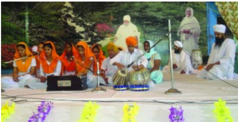
ਸੰਤ ਵਰਿਆਮ ਸਿੰਘ ਮੈਮੋਰੀਅਲ ਪਬਲਿਕ ਸਕੂਲ ਰਤਵਾੜਾ ਸਾਹਿਬ ਦੇ ਬੱਚੇ 17 ਜੂਨ ਨੂੰ ਸ਼ਬਦ ਕੀਰਤਨ ਰਾਹੀਂ ਨਿਹਾਲ ਕਰਦੇ ਹੋਏ।

ਇਕ ਘੰਟੇ ਵਿੱਚ 18000 ਤੋਂ ਵੱਧ ਪ੍ਰੇਮੀ ਲੰਗਰ ਛਕ ਜਾਂਦੇ ਸਨ। (ਮਹਾਂਪੁਰਖਾਂ ਦੀ ਚਲਾਈ ਪ੍ਰਾਪਤੀ ਅਨੁਸਾਰ ਹੁਣ ਵੀ ਇਹ ਸਮਾਗਮ ਆਉਣ ਵਾਲੀ ਮਿਤੀ 28, 29, 30 ਅਤੇ 31 ਅਕਤੂਬਰ ਨੂੰ ਰਤਵਾੜਾ ਸਾਹਿਬ ਦੀ ਮਹਾਨ ਤਪੋ ਭੂਮੀ ਉਪਰ ਮਹਾਂਪੁਰਖਾਂ ਦੀ ਬਰਸੀ ਦੇ ਰੂਪ ਵਿੱਚ ਮਨਾਏ ਜਾਂਦੇ ਹਨ। ਜਿਸ ਵਿੱਚ ਮਹਾਂਪੁਰਖਾਂ ਨੂੰ ਪਿਆਰ ਕਰਨ ਵਾਲੇ ਅਨੇਕਾਂ ਦੇਸ਼ ਵਿਦੇਸ਼ਾਂ ਤੋਂ ਪ੍ਰੇਮੀ ਰਤਵਾੜਾ ਸਾਹਿਬ ਪਹੁੰਚ ਰਹੇ ਹਨ। ਸਾਡੇ ਕੋਲ ਈਮੇਲ ਟੈਲੀਫੋਨ, ਮੋਬਾਇਲ ਫੈਕਸ ਰਾਹੀਂ ਸਨੋਹੇ ਆ ਰਹੇ ਹਨ, ਉਨ੍ਹਾਂ ਦੀ ਦੇਖ ਰੇਖ ਯੋਗ ਰਿਹਾਇਸ਼ ਦਾ ਪ੍ਰਬੰਧ ਰਤਵਾੜਾ ਸਾਹਿਬ ਕੰਪਲੈਕਸ ਅੰਦਰ ਹੀ ਕੀਤਾ ਗਿਆ ਹੈ, ਤਾਂ ਜੋ ਸੰਗਤਾਂ ਚਾਰ ਦਿਨ