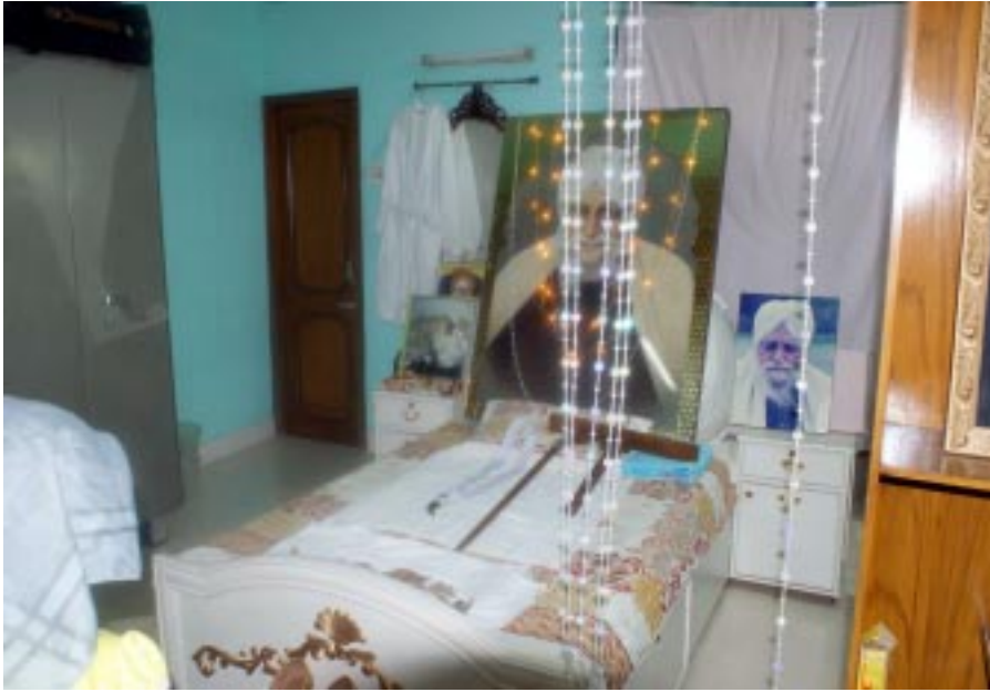
ਰਤਵਾੜਾ ਸਾਹਿਬ ਦੇ ਬਾਨੀ ਮਹਾਂਪੁਰਖਾਂ ਦਾ ਨਿਵਾਸ ਅਸ਼ਥਾਨ ਰਤਵਾੜਾ ਸਾਹਿਬ ਵਿਖੇ ਜਿਥੇ ਬੈਠ ਕੇ ਆਪ