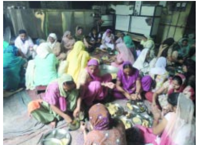
17 ਜੂਨ ਨੂੰ ਬੀਬੀਆਂ ਲੰਗਰਾਂ ਵਿੱਚ

ਉਜਾੜ ਜੰਗਲ ਬੀਆਵਾਨ ਨੂੰ ਅਬਾਦ ਕਰਨ ਵਾਸਤੇ ਆਪ ਜੀ ਨੇ ਆਪਣੀ ਪੂਰੀ ਸ਼ਕਤੀ ਰਤਵਾੜਾ ਸਾਹਿਬ ਅਸਥਾਨ ਤੇ ਲਗਾ ਦਿੱਤੀ ਹੈ। ਅਨੇਕਾਂ ਕਾਰ ਸੇਵਾ ਅਸਥਾਨ ਤੇ ਚਲਾਈਆਂ ਗਈਆਂ ਜਗਿਆਸੂ ਭੋਰਿਆਂ