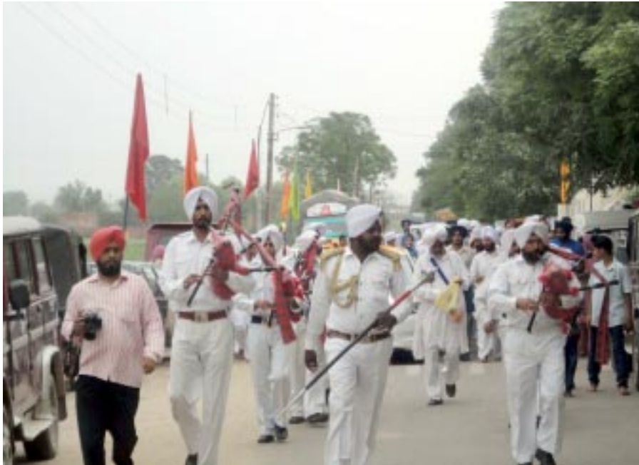
ਪਰਮ ਸਤਿਕਾਰਯੋਗ ਬੀਜੀ 17 ਜੂਨ ਰਤਵਾੜਾ ਸਾਹਿਬ ਪਹੁੰਚਣ ਤੇ ਬੈਂਡ ਬਾਜੇ ਨਾਲ ਸੰਗਤਾਂ ਸਵਾਗਤ ਕਰਦੀਆਂ ਹੋਈਆਂ

ਮਹਾਰਾਜ ਦੀ ਪਵਿੱਤਰ ਚਰਨ ਸ਼ੋਹ ਪ੍ਰਾਪਤ ਰਤਵਾੜਾ ਸਾਹਿਬ ਅਨੇਕਾਂ ਹੀ ਕਾਰਜ ਚਲਾਏ ਜਾ ਰਹੇ ਹਨ। ਆਪ ਨੇ ਆਪਣੇ ਕਰ ਕੰਵਲਾਂ ਦੁਆਰਾ ਤੇ