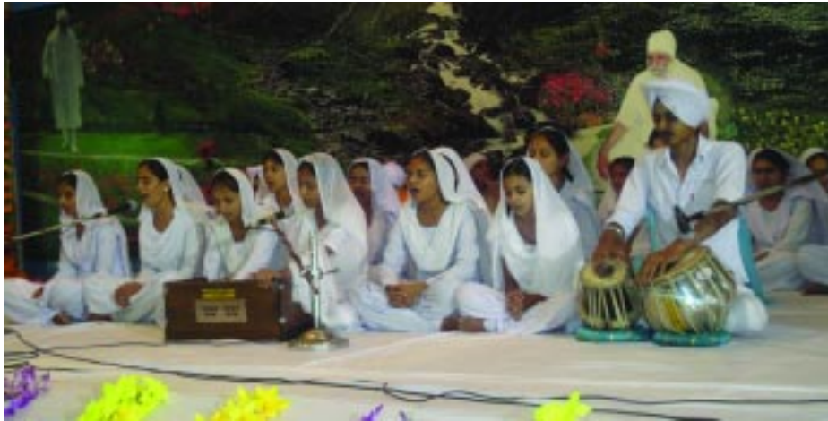
ਗੁਰੂ ਗੋਬਿੰਦ ਸਿੰਘ ਵਿਦਿਆ ਮੰਦਰ ਸੀਨੀਅਰ ਸੈਕੰਡਰੀ ਸਕੂਲ ਦੇ ਬੱਚੇ 17 ਜੂਨ ਨੂੰ ਸ਼ਬਦ ਕੀਰਤਨ ਰਾਹੀਂ ਨਿਹਾਲ ਕਰਦੇ ਹੋਏ।

ਇਹ ਇਕ ਬਹੁਤ ਵੱਡੀ ਸਫਲਤਾ ਸੀ ਜਿਸ ਦੇ ਸਿੱਟੇ ਵੱਜੋਂ ਇਨ੍ਹਾਂ ਨੂੰ ਸਿੱਖੀ ਨਾਲ ਐਤਨਾ ਪਿਆਰ ਹੋਇਆ ਕਿ ਮਹਾਂਪੁਰਖਾਂ ਨੂੰ ਸਮਾਗਮਾਂ ਵਿੱਚ ਸ਼ਾਮਲ ਦੇਣ ਵਾਲੇ ਪ੍ਰੇਮੀਆਂ ਲਈ 1000x240 ਫੁੱਟ ਦੇ ਮਹਾਨ ਪੰਡਾਲ ਹਰ ਸਾਲ ਲਾਉਣੇ ਪਏ। 300x180 ਫੁੱਟ ਦੇ ਵਿਸ਼ਾਲ ਪੰਡਾਲ ਲੰਗਰ ਛਕਣ ਵਾਲਿਆਂ ਲਈ ਲਾਉਣੇ ਪਏ ਜਿਥੇ