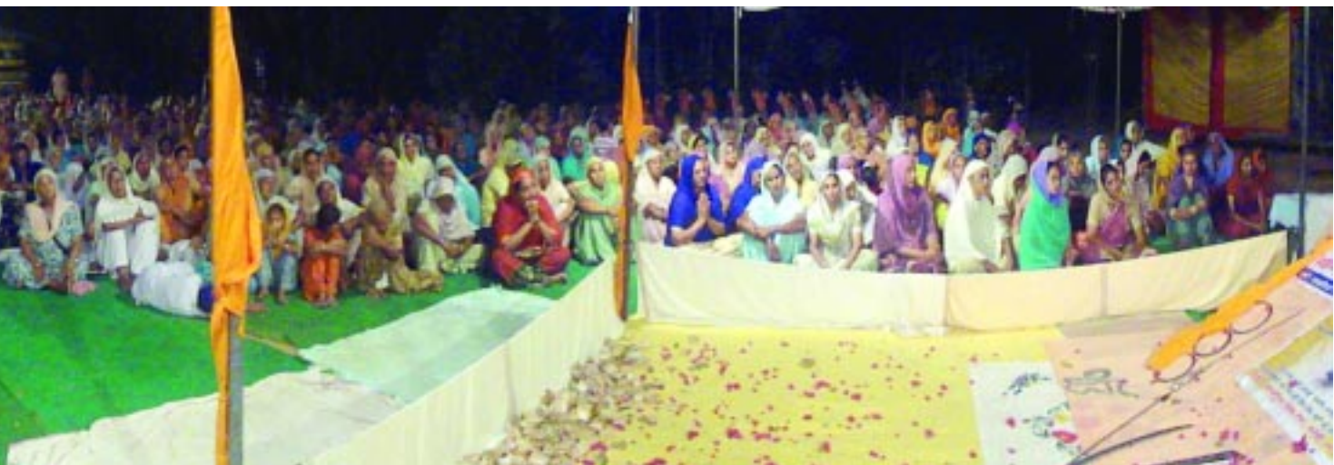
ਠਾਠਾਂ ਮਾਰਦਾ ਇਕੱਠ