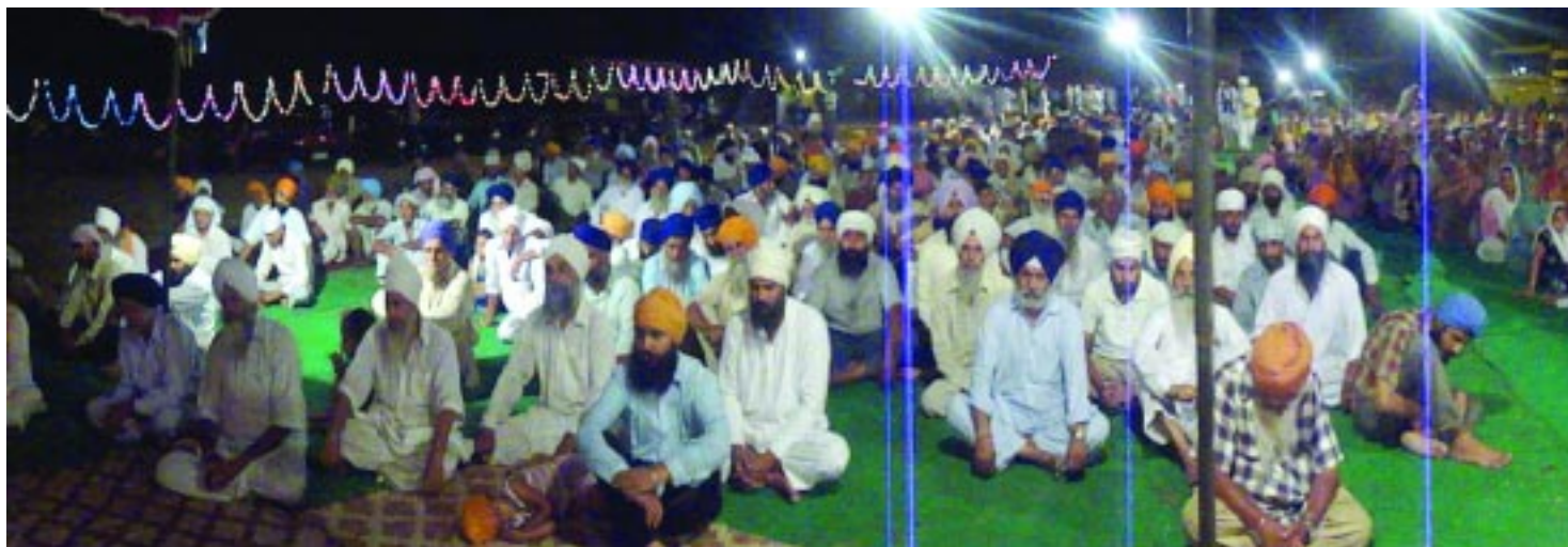
ਪਿੰਡ ਭੱਟੋਂ ਵਿਖੇ ਸੰਗਤਾਂ ਦ