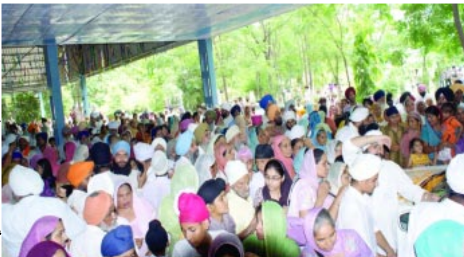
ਸਾਥੀ ਪਰਮ ਸਤਿਕਾਰਯੋਗ ਬੀਜੀ ਦੇ ਦਰਸ਼ਨ ਕਰਦੀਆਂ ਹੋਈਆਂ।

ਨਿਸਿ ਬਾਸੁਰ ਨਖਿਅਤੁ ਬਿਨਾਸੀ ਰਵਿ ਸਸੀਅਰ ਬੋਨਾਧਾ ॥ ਗਿਰਿ ਬਸੁਧਾ ਜਲ ਪਵਨ ਜਾਇਗੋ ਇਕਿ ਸਾਧ ਬਚਨ ਅਟਲਾਧਾ ॥ ਅੰਡ ਬਿਨਾਸੀ ਜੇਰ ਬਿਨਾਸੀ ਉਤਭੁਜ ਸੇਤ ਬਿਨਾਧਾ ॥ ਚਾਰਿ ਬਿਨਾਸੀ ਖਟਹਿ ਬਿਨਾਸੀ ਇਕਿ ਸਾਧ ਬਚਨ ਨਿਹਚਲਾਧਾ ॥ ਰਾਜ ਬਿਨਾਸੀ ਤਾਮ ਬਿਨਾਸੀ ਸਾਤਕੁ ਭੀ ਬੋਨਾਧਾ ॥ ਦ੍ਰਿਸਟਿਮਾਨ ਹੈ ਸਗਲ ਬਿਨਾਸੀ ਇਕਿ ਸਾਧ ਬਚਨ ਆਗਾਧਾ ॥