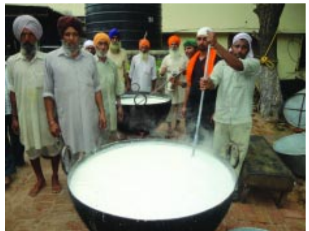
17 ਜੂਨ ਨੂੰ ਗੁਰੂ ਕੇ ਲੰਗਰਾਂ ਵਿੱਚ ਸੇਵਾਦਾਰ ਸੇਵਾ ਵਿੱਚ ਤੱਤਪਰ

ਵਾਂਗ ਨਾਮ ਬਾਣੀ ਦੀ ਮਹਿਕ ਲੈਣ ਵਾਸਤੇ ਲਗਾਤਾਰ ਆਉਣ ਲੱਗੇ ਜਿੱਥੇ ਪਹਿਲਾਂ ਜੰਗਲ ਬੇਲੇ, ਸਰਕੜਾ ਸੀ ਉਸ ਨੂੰ ਸੰਗਤਾਂ ਦੇ ਸਹਿਯੋਗ ਨਾਲ ਪੁੱਟਣ ਲਈ ਸੰਗਤਾਂ ਨੇ ਆਪਣਾ ਯੋਗਦਾਨ ਆਪਣੇ ਟਰੈਕਟਰਾਂ ਟਰਾਲੀਆਂ ਰਾਂਹੀ ਸੇਵਾ ਕਰਕੇ ਪਾਇਆ। ਅਸਥਾਨ ਤੇ ਆਪ ਜੀ ਦੀ ਦੇਖ ਰੇਖ ਹੇਠ ਦਿਨ ਦੁਗਣੀ ਰਾਤ ਦੁਣੀ ਚੌਗਣੀ ਤਰੱਕੀ ਹੋ ਰਹੀ ਹੈ। ਆਸ਼ਰਮ ਦੇ ਨਾਲ